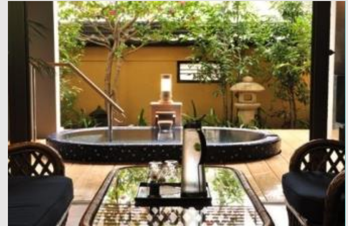
3차 체험/관광 서비스