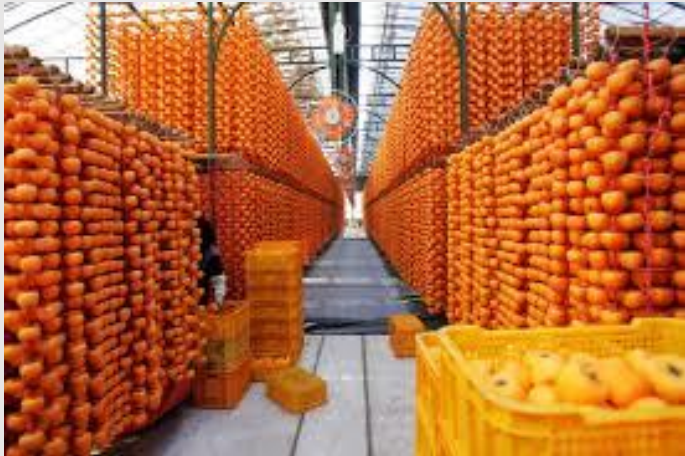
1차 감, 개복숭아 재배/생산

마을자원을 100%활용하고 안정적으로 좋은 품질의 물품을 생산하여 마을주민이 함께 잘살고 행복한마을, 믿고 소비할수 있는 물품을 제공하고 함께 나누는 목표를 이루고자합니다.