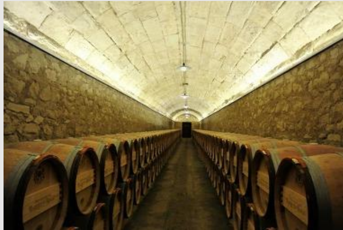
2차 물품 가공/유통