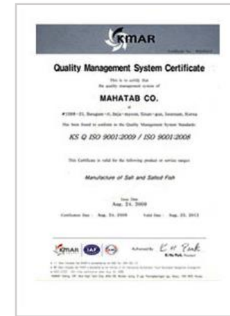
품질경영시스템 ISO 인증 ISO 9001:2008