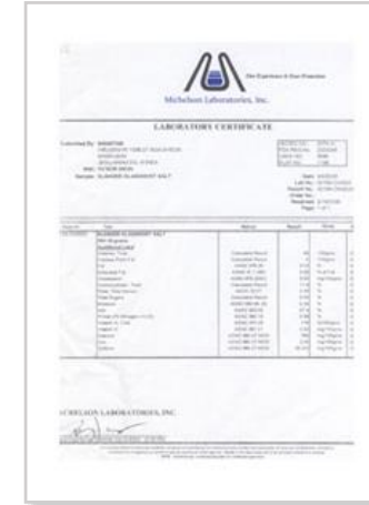
미국 FDA 검사, 친환경농산물인증 (함초소금)