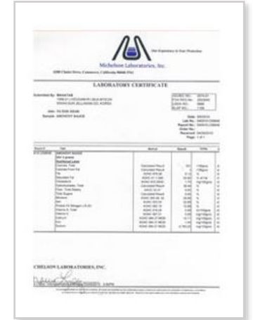
미국 FDA 검사, 친환경농산물인증 (멸치액젓)