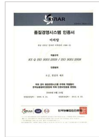
품질경영시스템 ISO 인증 KS Q 10S 9001:2009