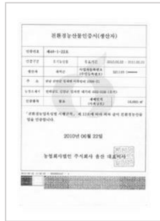
미국 FDA 검사, 친환경농산물인증 (함초유기재배)