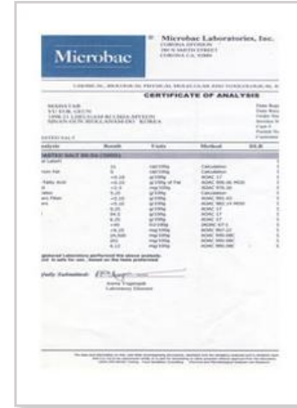
미국 FDA 검사, 친환경농산물인증 (붉은소금)