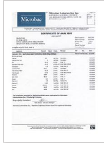
미국 FDA 검사, 친환경농산물인증 (천일염)

우리나라 친환경친일염을 생산하고 보존하며 생명, 환경, 그리고 자연과 함께하는 마하탑입니다.