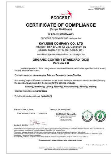
OCS v2.0 인증