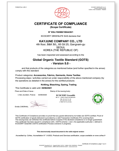
GOTS v5.0 인증