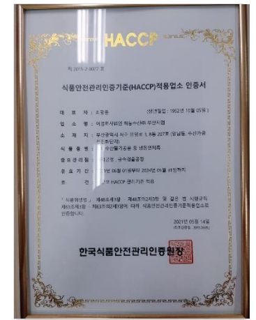
식품안전관리인증기준 (HACCP) 적용업소 인증(제2015-2-8077호 : 연체류)