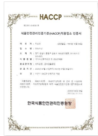
식품안전관리인증기준 (HACCP) 적용업소 인증(제2011-3-8154호 : 연체류)