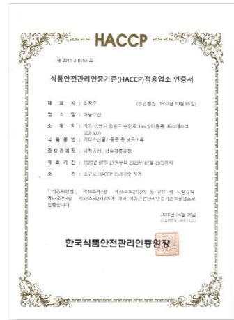
식품안전관리인증기준 (HACCP) 적용업소 인증(제2011-3-8153호 : 어류)