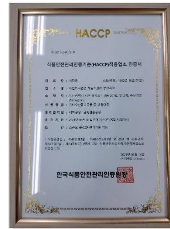
식품안전관리인증기준 (HACCP) 적용업소 인증(제2015-2-8076호 : 어류)