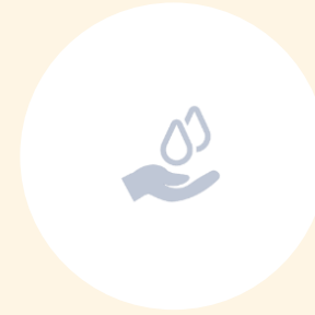
원료의 제품화 가능성 및 적합성 타진