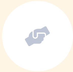
원물 구매처 교류 및 협약