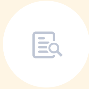
피부 효능효과 검토